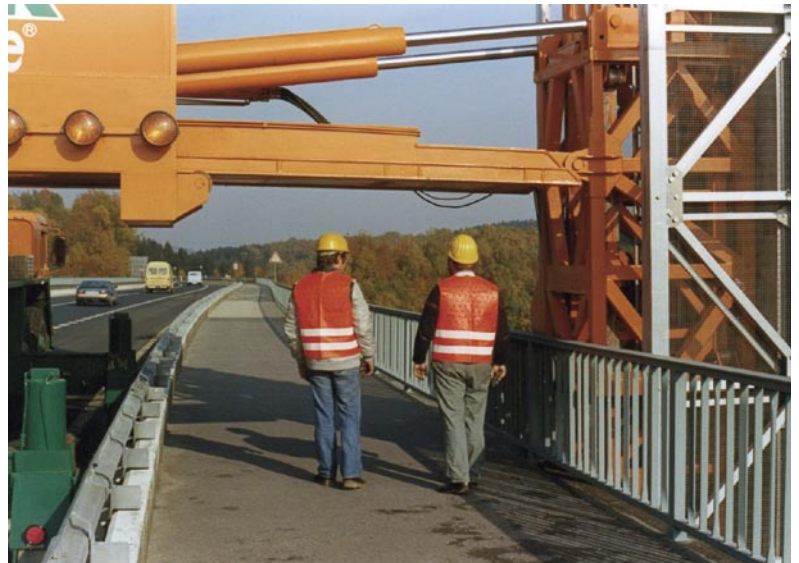
Reichweite über Geh- und Radwege bis 4,40 m