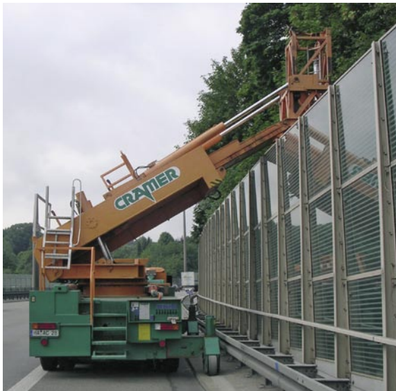
Über Lärmschutzwände bis 5,20 m