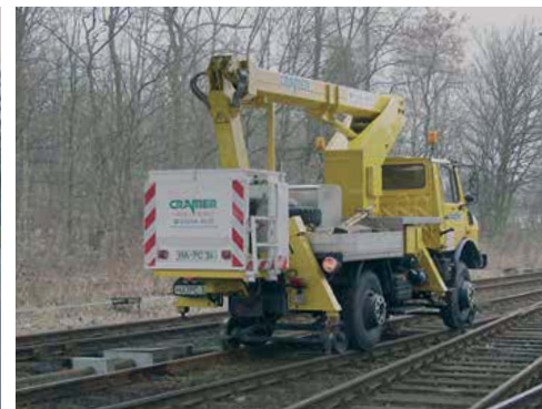
Fahrt auf DB Gleisen bis 25 km/h