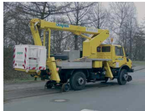
Aufgleisen, problemlos in wenigen Sekunden