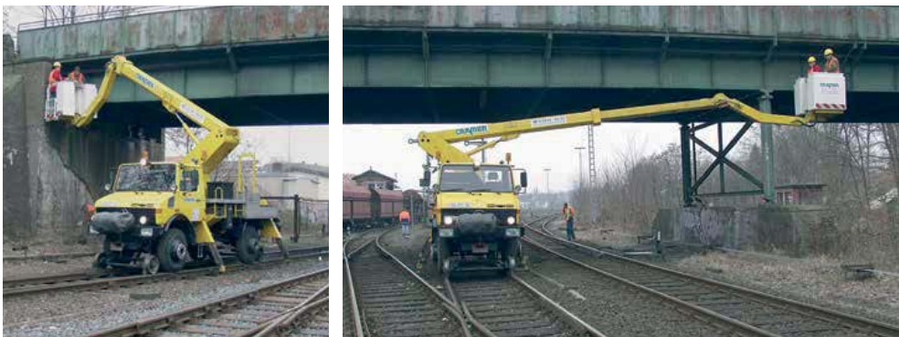
Arbeiten auf engstem Raum - aber auch mit großer Reichweite.